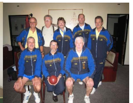
1. Mannschaft Bohle – Oberliga belegt z.Z. den 9. Tabellenplatz