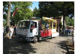
Umzug Schollenfest 2009

Gesamtausschussversammlung: 23. April – 19.00 Uhr im Vereins-Kasino am Wackerweg!