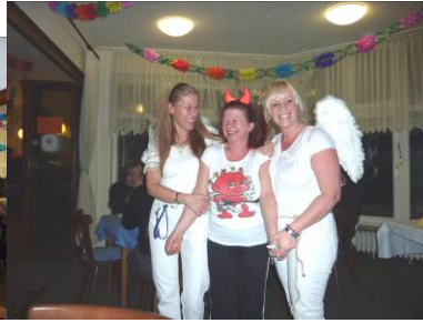
Drei Engel unterwegs