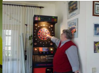
Wolfgang trifft die Mitte