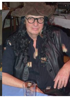
Wer war das?