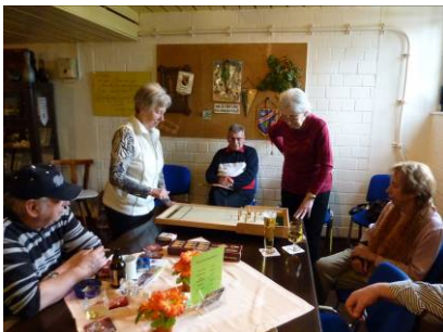
Tischkegeln geht leichter