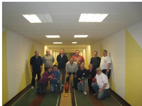
Die Triathleten nach dem Kegeln