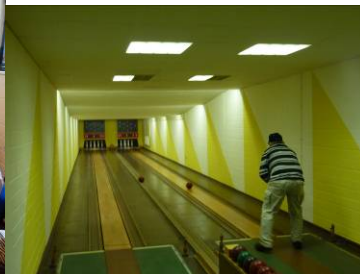
Georg will alle Neune