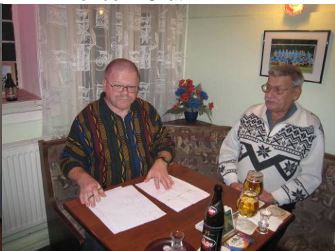
und der Verfasser bei der Auswertung