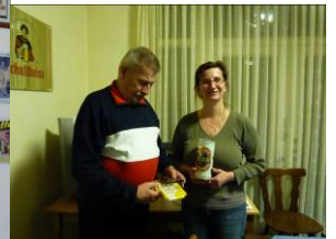
Preise für alle!