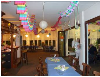
Vor dem Ansturm!?