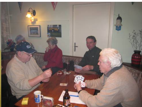
hier beim Skat